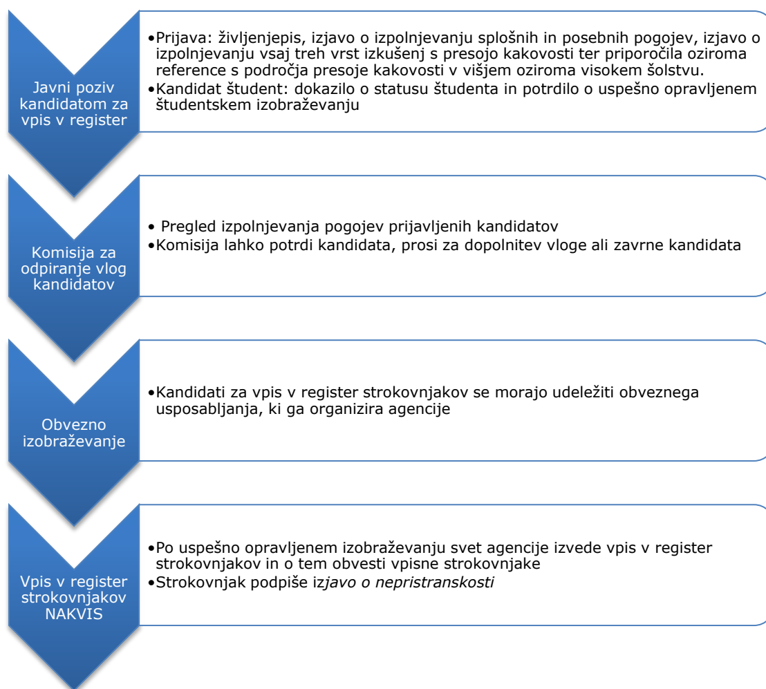
Slika 2: Postopek vpisa v register strokovnjakov – javni poziv kandidatom

Zaradi stalne nadgradnje znanja s področja zagotavljanja kakovosti se morajo v register strokovnjakov vpisani strokovnjaki po potrebi udeleževati delavnic in izobraževanj, ki jih v ta namen organizira agencija, študenti pa še študentskih izobraževanj s področja kakovosti v višjem oziroma visokem šolstvu po programu, ki ga potrdi svet agencije.